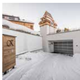
Schneesicher Die Piste und das Auto!