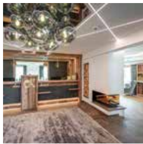
Rezeption & Lobby Herzlich willkommen!