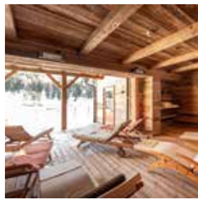
Outdoor-Spa Sauna und überdachte Frischluftarea