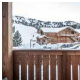
Direkt an der Piste K-Hotel, K-Alm & K-Stadl