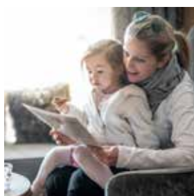
Zur Ruhe kommen Zeit fürs Wesentliche